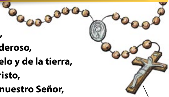
Creo de los Apóstles

Creo en el Espíritu Santo, la santa Iglesia católica, la comunión de los santos, el perdón de los pecados, la resurrección de la carne y la vida eterna. Amén.